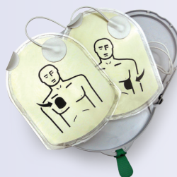
Pad-Pak et Pediatric-Pak avec électrodes pré-attachées

Faible coût de propriété La cartouche a une durée de vie de 4 ans à partir de la date de fabrication, offrant ainsi d'importantes économies par rapport aux autres défibrillateurs qui nécessitent une batterie et des électrodes séparées.